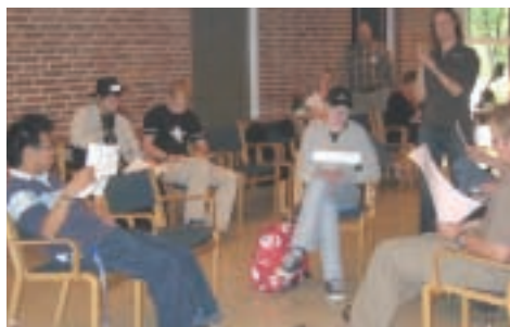
Fotos er fra DSI's første ungeseminar i 2004

Projekt "Børn og unge med handicap siger deres mening" kører frem til sommeren 2008.