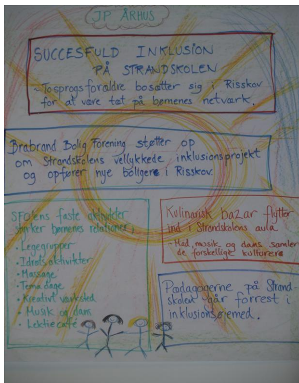
Avisforsider fra to afdelinger i SFO

Derefter var der cafédialog på tværs af de to SFO'er, hvor der blev talt ud fra følgende spørgsmål: