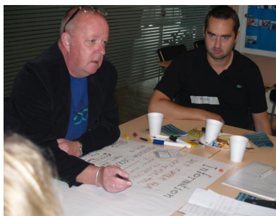
Stemningsbilleder fra lørdagen