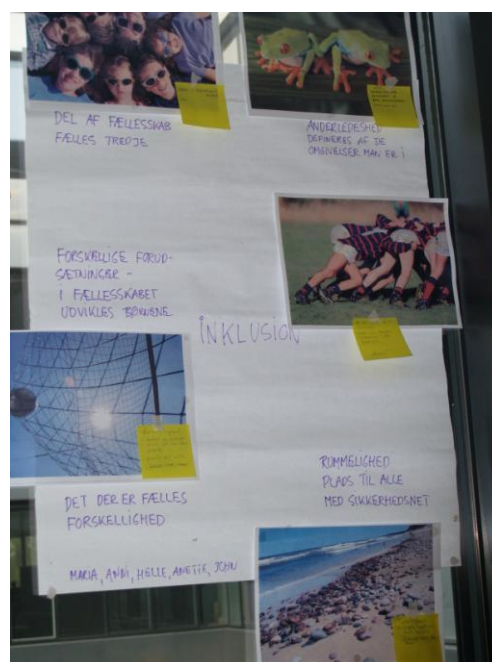
Billedøvelse – at forstå inklusionsbegrebet bredere