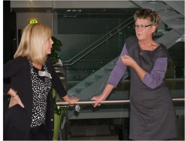
Stemningsbilleder fra lørdagen