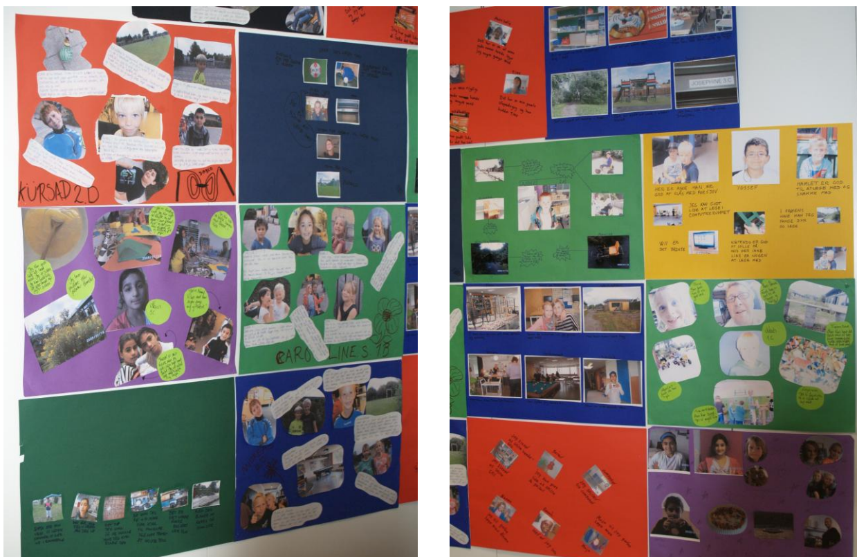
Eksempler på fotocollager lavet af børnene i SFO