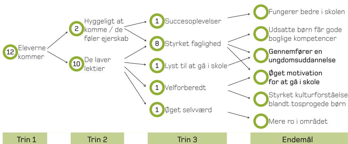
Figur 4.1. Forandringsteori for lektiecaféerne med udviklingstrin og endemål.

Figuren er baseret på resultatevaluering for 12 boligsociale lektiecaféer. Projekterne har opstillet en forandringsteori, som i en resultatevaluering er omsat til tre udviklingstrin og et endemål, der belyser hvordan lektiecaféerne vil påvirke brugerne på en række områder både fagligt, personligt og socialt. Trin 1 og 2 omfatter de umiddelbare resultater af lektiecaféernes indsats, som danner grobund for de kompetencer, der udvikles på kort sigt (trin 3) og på længere sigt (endemål). Tallene i figuren viser, hvor mange ud af de 12 indsættere har defineret de forskellige udviklingstrin. F.eks. har otte af de 12 indsættere i trin 3 en målsætning, der omhandler "styrket faglighed" blandt eleverne i lektiecaféen.