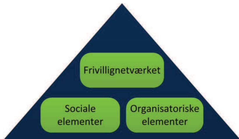
Figuren illustrerer, at der er tre elementer i evalueringen, som har betydning for fastholdelsen.

Evalueringsanalysen tager udgangspunkt i to undersøgelsesspørgsmål, der er operationaliseret til fire evalueringsspørgsmål specifikt i forhold til frivillignetværket, og to evalueringsspørgsmål i forhold til sociale og organisatoriske elementer, der også virker til fastholdelse i Bogruppen Holmstrupgård.