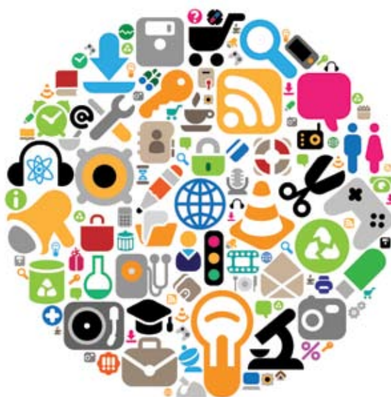
CLH får henvendelser om mange forskellige problemstillinger på handicapområdet.

De mange henvendelser, CLH får om fleksjob og job med løntilskud til førtidspensionister, giver samtidig vigtige informationer om reglernes svagheder, og hvilke spørgsmål det er vigtigt vores pjecer om ordningerne skal kunne besvare. De mange spørgsmål og den systematiske opsamling af disse spørgsmål er en vigtig forklaring på den store succes, de to pjecer om fleksjob og job med løntilskud til førtidspensionister har fået.