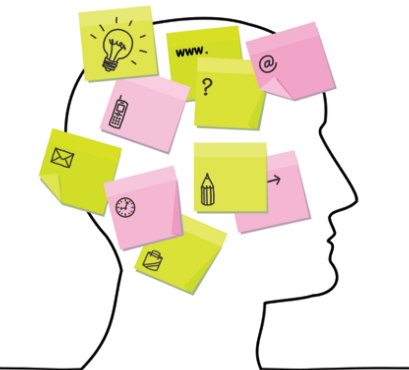
CLH benytter flere kanaler for at få sit budskab igennem.

CLH har i perioden haft besøg af udenlandske delegationer fra henholdsvis Finland, Grønland, Armenien, Ghana, Øst-europa, Japan, Rusland og Filippinerne.