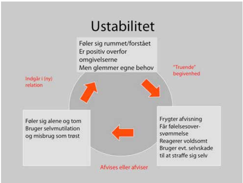
Figur 2. Mennesker med borderline kan befinde sig i en "følelses-karrusel" med ustabil humør.

Selvdestruktive handlinger ses også i form af misbrug . Over 2/3 af mennesker