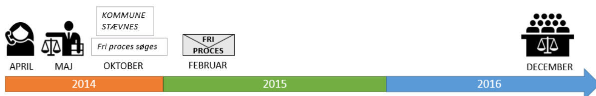
Figur 2: Forløb i igangværende erstatningssag

Sagsforløbet i de to sager, hvor der er blevet udbetalt erstatning i 2014, blev afviklet på under et halvt år fra november 2013 til marts 2014. Det skyldes, at kommunen erkendte sit ansvar uden retssag. Der blev derfor hverken behov for at søge om fri proces eller for at vente på behandling ved domstolene.