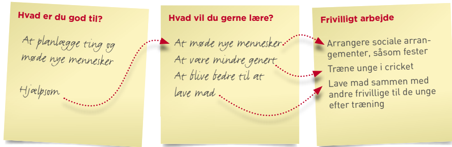
Eksempel på delvist udfyldt Erkendelsestabel