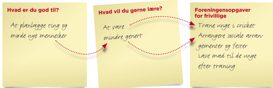
Eksempel på delvist udfyldt Erkendelsestabel